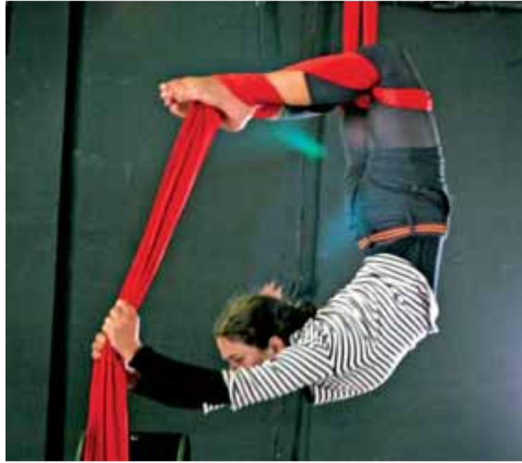
Nová scéna patřila akrobatkám na šálách ze souboru alternativního cirkusu.

„Myslím, že to může být i super prostor pro naše nadační aktivity. Výstavy a koncerty,