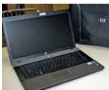
Díky NOKD pořídili moderní počítače.