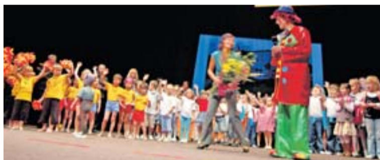
Závěrečná děkovačka dětí s klaunem Hopsalínem na akademii podpořené NOKD.

Potlesku se dočkaly nejen děti z této školky se svými výstupy – Myši kalamajkou, Irskými tanečnými a Šmoulím sportováním – ale také kluci a děvčata z MŠ Okružní, Duha, Lutyňská, Radost, K. Dvořáčka a ZŠ K. Dvořáčka. Mezi