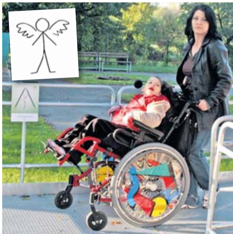
NOKD už pomohla škole s rampou pro vozíčkáře.

Občanské sdružení při Škole plné zážitků hodlá za peníze z „kapříkové“ předvánoční sbír-