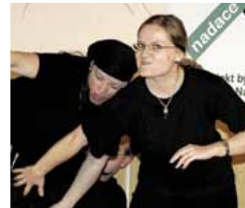
Hornická dcera „Malá Jana“.

Hornická dcera se k improvizčnímu divadlu dostala při studiu na Ostravské univerzitě. „V rámci dramatické výchovy, což je má specializace pro první stupeň základní školy, jsem se před několika lety zúčastnila workshopu na dané téma. Vedli ho lidé, kteří to přivezli z Francie,“ upřesnila s tím, že když zakrátko její kamarád zakládal Oliny – předchůdce Ostružin – neváhala a přidala se k nim.