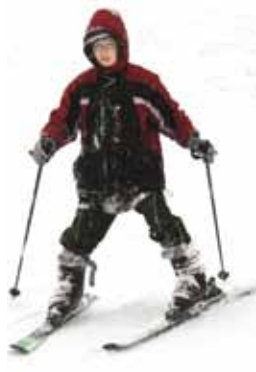
Účastníci výletu si v Beskydech užili sněhu dosytosti.