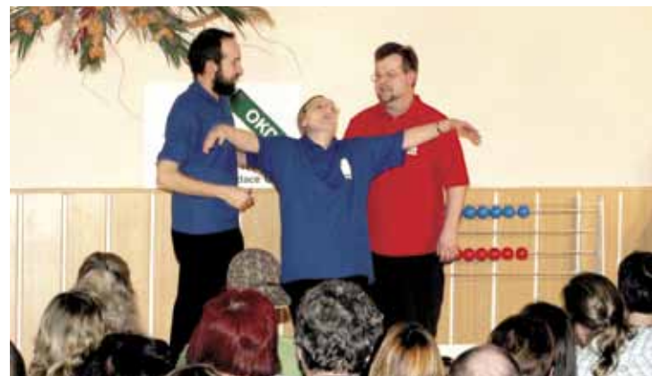
Divadelní improvizace v klubovně zahrádkářů v Petřvaldě.