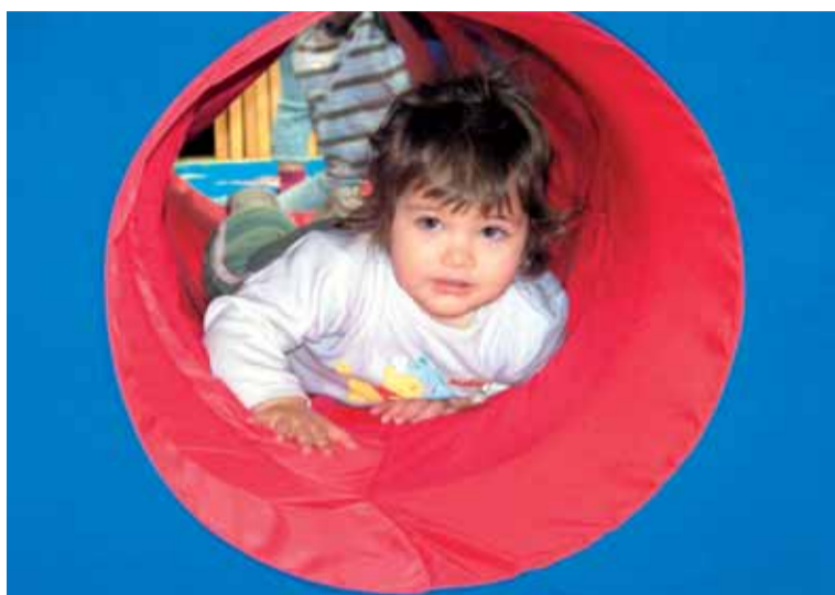
Největší podpora Nadace OKD šla loni na podporu těm, kteří to nejvíce potřebují – tedy dětem, nemocným lidem a seniorům.

Neziskové organizace mohou získat peníze na podporu svých prospěšných projektů pro děti, seniory, nemocné lidi nebo životní prostředí