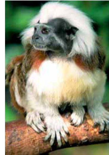
V expozici Malá Amazonie vybudované díky Nadaci OKD najde svůj nový domov opička s exotickým názvem tamarín pinčí.

Na pestrý program se mohou těšit hlavně děti. Jejich velká „Opičí cesta“ začne hned za branou do zahrady a přivede je až k pavilonu tamarína pinčho, kde za splnění úkoly (bude jich celkem pět) dostanou odměnu. A pokud na sobě budou mít zvířecí oděv nebo třeba obrázek zvířátka na triku nebo na čepici, budou z toho odměny rovnou dvě.