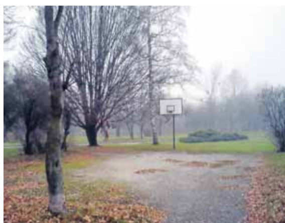
Havířov-Šumbark, zde vyrostou dětské a sportovní streetballové hřiště.

Softballem na sídlíšti ke sportovní radosti Sportovní klub Slávie Ostravská univerzita využije částku 800 tisíc korun na znovuoživení softballového hřiště na Dubině, přilákání nových hráčů a vytvoření mužského týmu. „Zatím máme jen kadetky a ženy,“ uvedla Lucie Kaplarzyková, která je pod projektem podepsaná. Ohlasy – pozitivní – už mají z okolních škol. „Získání podpory z Nadace OKD je obrovský úspěch, zviditelní to softball, vznikne základna pro práci s dětmi a mládeží,“ konstatovala.