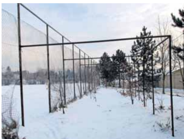
Ostrava-Jih, sídlíště Dubina, kde budou mít základnu hráči softballu.