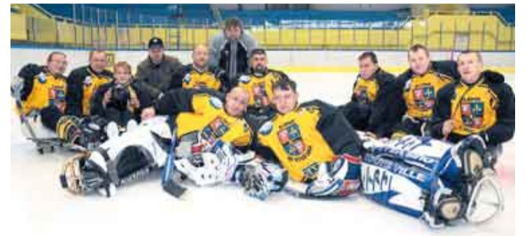
Nový tým po první sezoně sledge hokejové ligy.