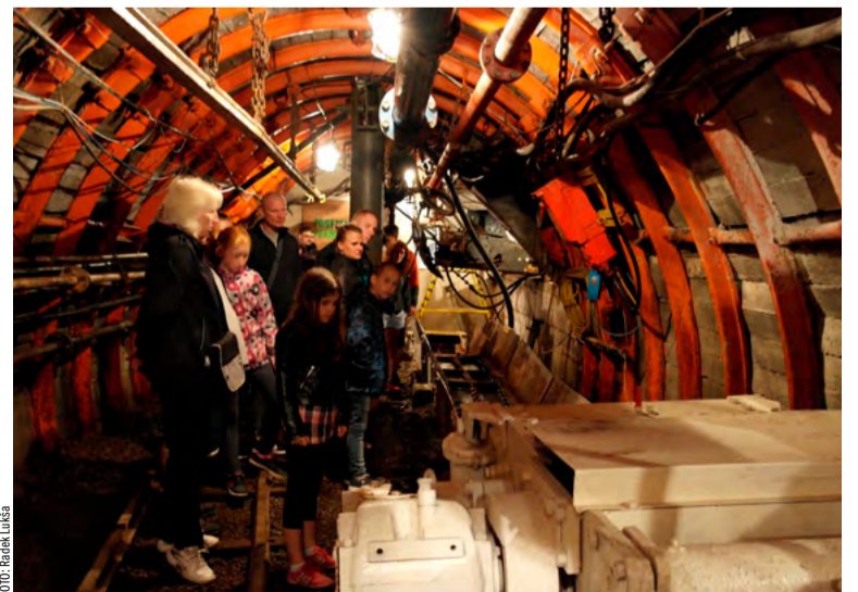
Staříčská štola, jedna z památek v bedekru.