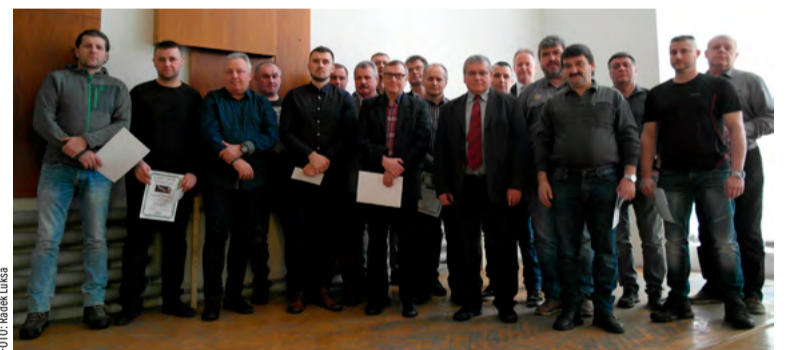
Vítězové z ČSA, Lazů a Darkova

„Třeba jen prvních pět kolektivů z ČSM jsme tady měli za první i druhé pololetí. Jen v jiném pořadí. Za mne to není moc dobré protože: Kde jsou ostatní kolektivy a úseky? V tom se nám otevírá další pole působnosti, proto je potřeba se na tento fakt zaměřit,“ uvedl