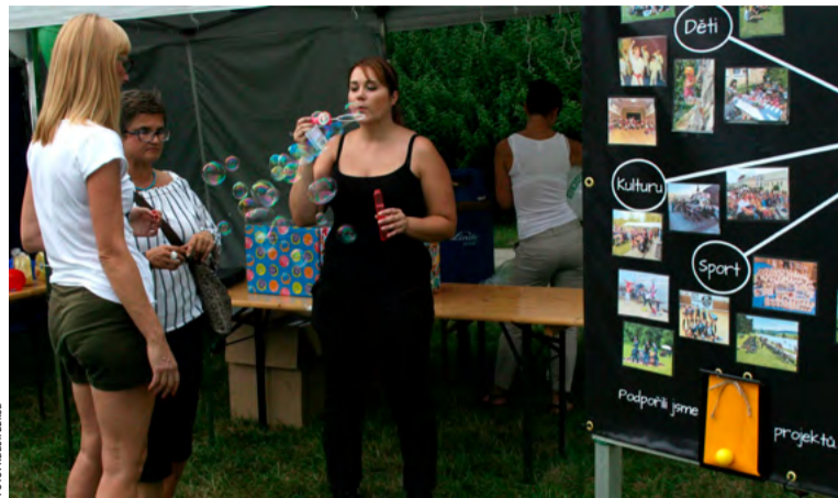
Chceme lidi i bavit, říká ředitelka těžařské nadace (vpravo).

Závěr roku byl dosti smutný a náročný. Neštěstí, které se stalo na ČSM těsně před vánočními svátky, zasáhlo i nehornické města a občany. A proto jsme se – po projednání se společností OKD – rozhodli ohlásit veřejnou sbírku a zřídili speciální bankovní účet, kam lidé mohli zaslat finanční dary rodinám postiženým důlním neštěstím. Během celého svátečního času jsme se snažili vždy poskytovat informace o aktuálních stavech výtěžku, protože jsme chtěli poskytnout příspěvatelům i veřejnosti informace, že sbírka je v souladu se zákonem. Na zákon narážíme i nyní, a to z důvodu ochrany osobních údajů, kdy společnosti nemohou poskytnout jakékoliv údaje třetí straně, což je právě nadace. Nicméně každá překážka má své řešení. V tuto chvíli jsme předali pozůstalým informa-