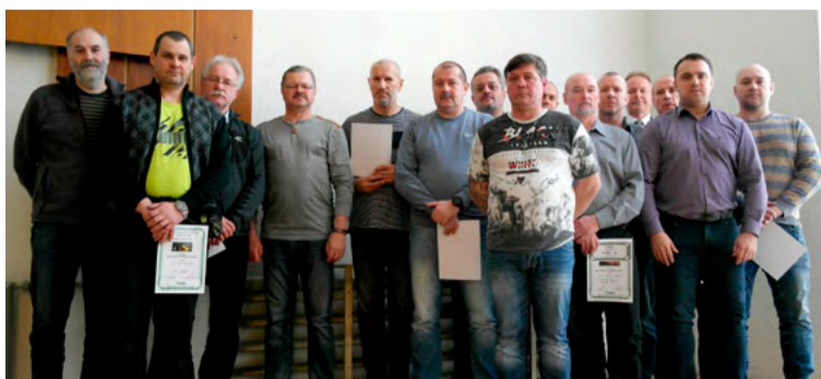
Vítězové z obou lokalit na ČSM.