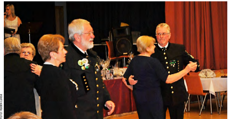
Havířský bál spolku z Dolu František.