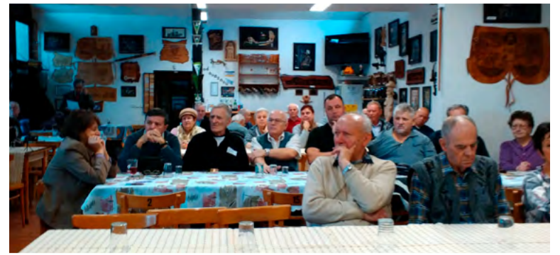
Valná hromada KVD OKD v Domečku.

Novinkou je elektronické podávání žádostí v systému Grantys. Ten toho umí spoustu a náš tým chce všechno Srdcaře naučit. Vůbec bychom rádi celou administraci přesunuli sem do Grantysu, aby měli Srdcaři vše na jednom místě. Včetně dokládání závěrečných zpráv. Ale neznamená to, že s námi ztrácí osobní kontakt, který je nepostradatelný pro naši práci. Srdcaři jsou pro nás velkým přínosem a inspirací, vždyť za docela málo peněz dokážou velké věci. Spousta z nich nás nabíjí energií, kterou přenášejí, když hovoříme o jejich projektech a plánech do budoucna. Věřím, že nás nevidí jako administrátorky, ale jako přátele. Srdcovka by nemohla být taková, jaká je bez vzájemné úcty, důvěry a spolupráce.