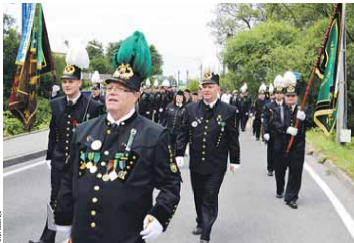
Za podpory NOKD loni důstojně slavili stonavští krojovaní horníci 100 let existence svého spolku.

Jako prioritu pro získání podpory posuzovala nadace zabezpečení základního chodu spolků. „Hlavně vytváření platformy pro udržování a rozvoj tradic se zvláštním důrazem na zvyklosti profesní – hornické – a místní – krajové – v oblasti kultury,“ přiblížila Drozdová. Zelenou dostaly také projekty po-