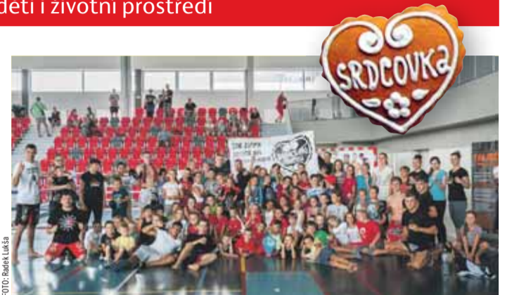
Účastníci třetího srdcovkového kempu bojových umění.