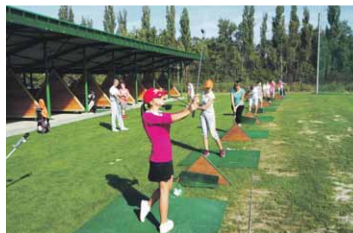
Dívky se rozhodně nenechaly ani ve velkém finále před chlapci zahanbit.