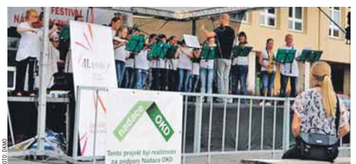
Festival národnostních kultur se v Orlové konal podeváté.