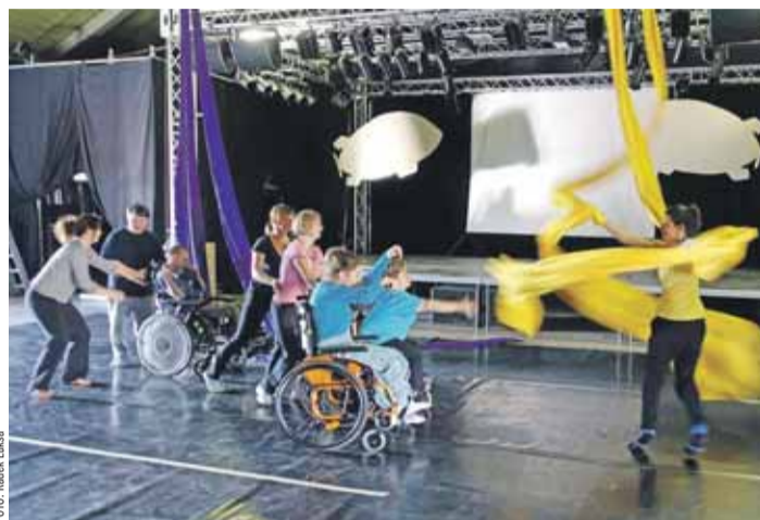
Dny před premiérami Cirkusu se nesou ve znamení horečného zkoušení.