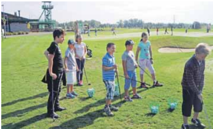
Golf Resort Lipiny hostil čtvrtý ročník Dětské akademie Nadace OKD.

„Do hornických rodin patří určitě i mnohé ze 140 dětí, které se letošního ročníku zúčastnily. U nás díky projektu Dětské akademie Nadace OKD dostaly šanci poprvé se postavit na skutečné golfové hřiště, kde se jim ve čtyřech lekcích zdarma věnovalo pět