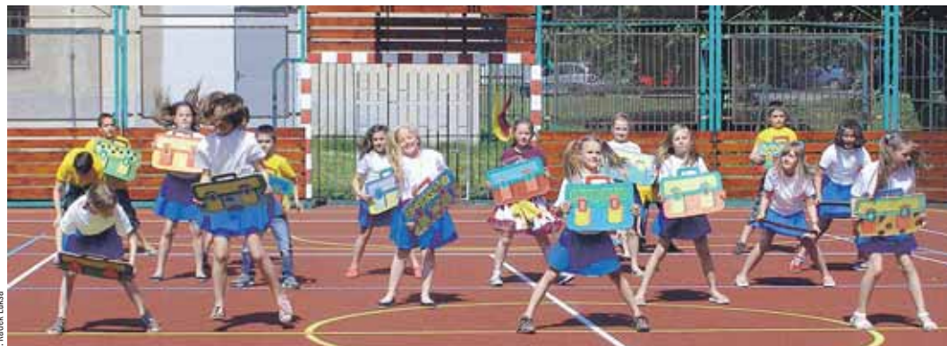
Dětský den letos pořádal na ZŠ U Lesa díky minigrantu Srdcovka.

KARVINÁ – Padesáté výročí vzniku si letos připomínají v ZŠ U Lesa v Ráji zároveň s tím, že v rámci okresu Karviná začali jako první vzdělávat zdravé děti spolu s hendikepovanými. Dnes jsou vozíčkáři či autisté, stejně jako jejich pedagogičtí asistenti ve třídách běžní a kamarádí se s žáky z podobné školy v jiném hornickém městě v Polsku. Děje se tak za pomoci těžažské nadace.