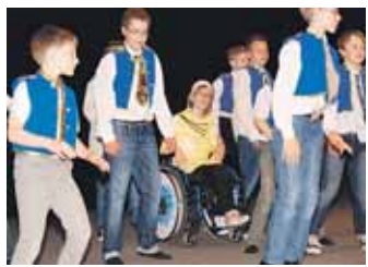
V akademii k 50. výročí školy se představitel zdraví i hendikepovaní.

„Chodí k nám celkem 365 dětí, z toho více než padesátka se zdravotním postižením, případně po-