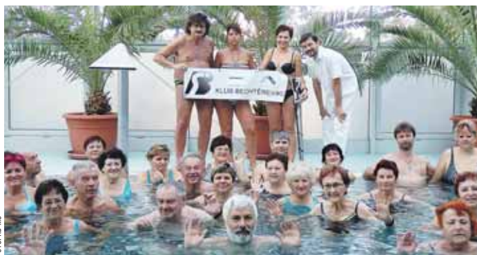
Bechtěrevici z Moravskoslezského kraje vyrazili i do Turčianských Teplic.