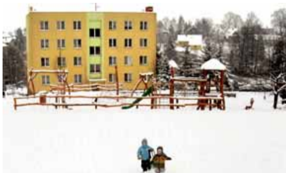
...a nová podoba veřejného prostranství je nejhezčí u nás.

KLIMKOVICE – Nejlepší úprava veřejného prostranství v České republice v roce 2009. Takové ocenění získalo hřiště pro děti a odpočinkový areál pro dospělé v Klimkovicích vybudované díky 800 „brigádnických“ hodinám oddělaným místními obyvateli a vybavené díky 350 tisícem korunám od Nadace OKD.