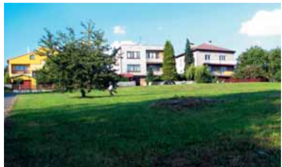
Ještě loni to vypadalo na místě budoucího Parčíku takto...

Klimkovicé mají díky obyvatelům a NOKD „Nejlepší úpravu veřejného prostranství v ČR v roce 2009“