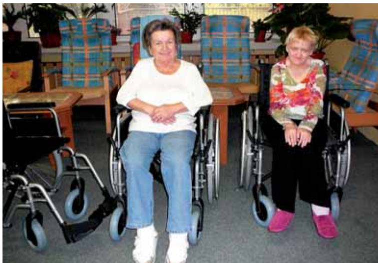
Seniorky v „domovince“ s novými vozíky pořízenými z nadačního příspěvku.

5. etapa provozují i odlehčovací či pečovatelskou službu.