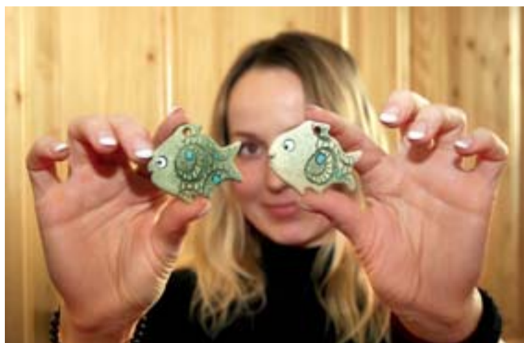
Prodejem originálních vánočních kapříků chce letos NOKD podpořit vybranou neziskovku.

Světelný koberec, promítačka na stěnu, speciální hudební nástroje... I tohle by rádi do takzvané „snoezellen“ multifunkční místnosti Základní školy