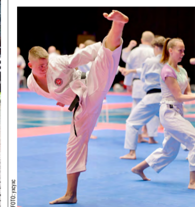
Na přípravu karatistů přispěla Nadace OKD.