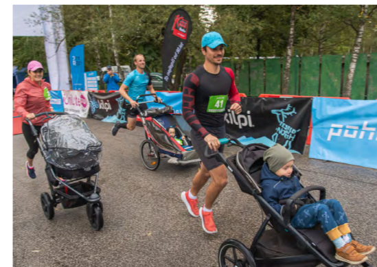
Běh rodičů s kočárky.

Nastínila také další plány: V roce 2023 hodlají organizátoři do uni- kátní pohornické krajiny do- stát rovnou Mistrovství ČR v běhu na 50 kilometrů.