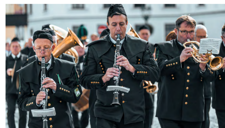
Úvodem zazněla Hornická hymna.

Ten také mezi prvními položil věnec k pomníku hornických obětí u Slezské univerzity. Poté se účastníci pietního aktu, doprovázeného hudbou havířské dechovky Akordanka, vypravili v průvodu do kostela Povýšení Svatého Kříže na mši za zemřelé i žijící generace horníků. Mezi hosty oficiální části programu byli také zástupci PRISKO, města, kraje i firem, které dlouhodobě s těžební společností spolupracují.