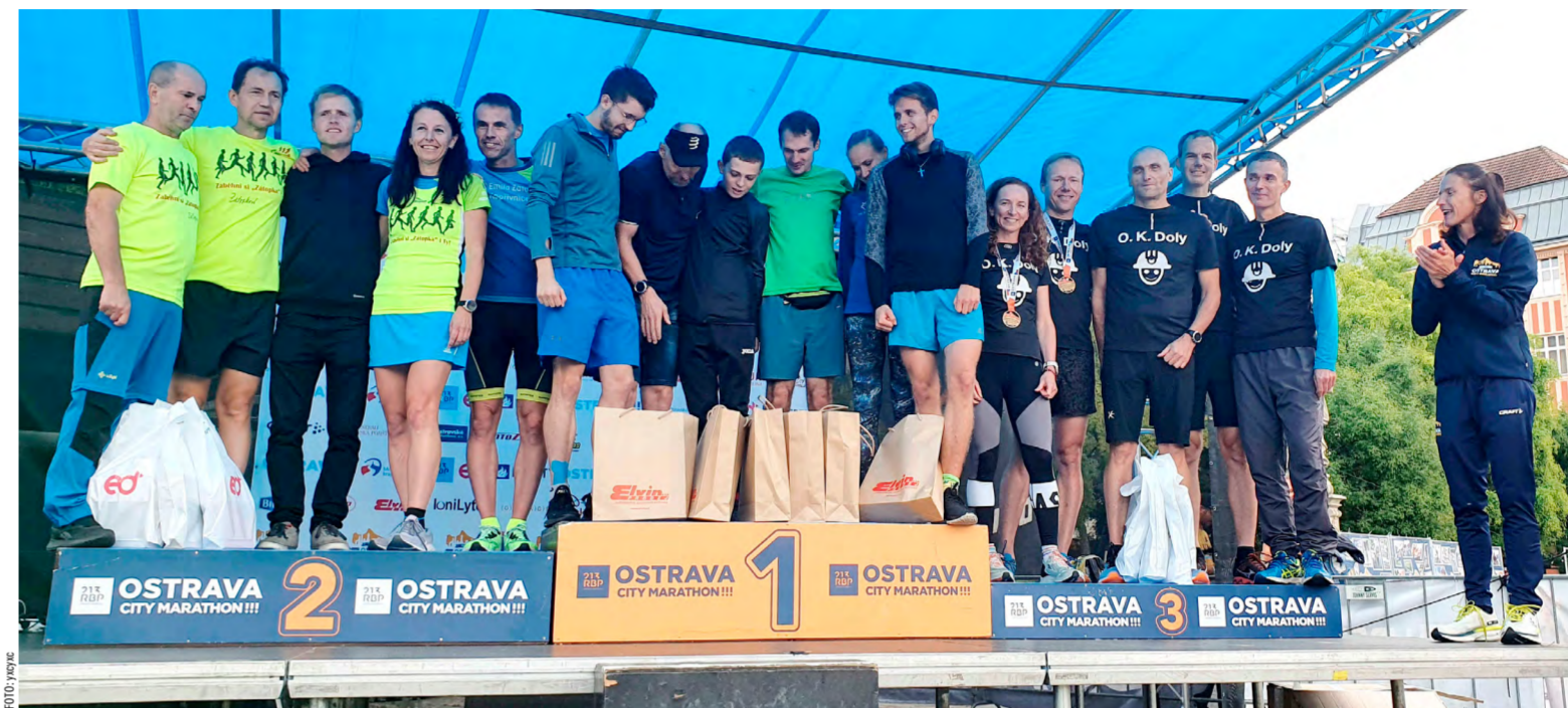
O.K.Doly se umístila i na stupních vítězů.

Ostrava – Na třetí příčce mezi celkem šestadesáti smíšenými firemními štafetami na RBP Ostrava City Marathonu byla ta s názvem O.K.Doly. Tvůřili ji samozřejmě běžci z OKD a její celkový čas činil 2 hodiny 50 minut a 33 sekund. Svůj úspěch ještě zamě- stnanci těžební společnosti korunovali sedmým místem v absolutním pořadí všech sedmadesáti štafet.