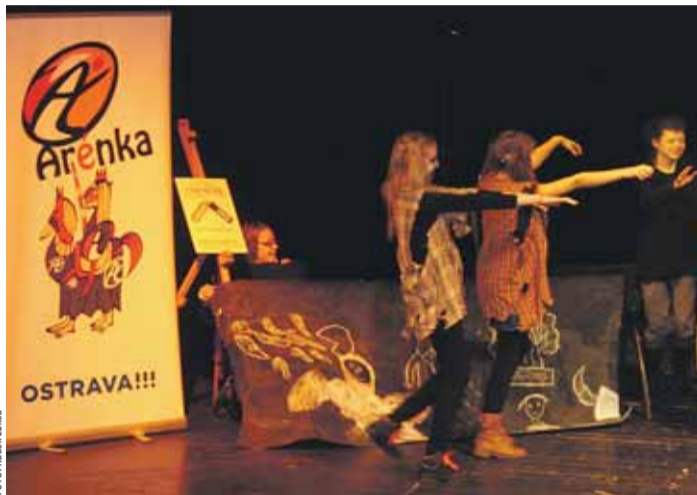
Děti ze ZŠ Ukrajinská zapracovaly do svého představení i zombie.