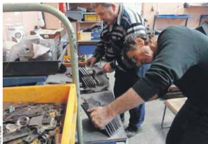
Zaměstnávání hendikepovaných, priorita Trianonu i Nadace OKD.