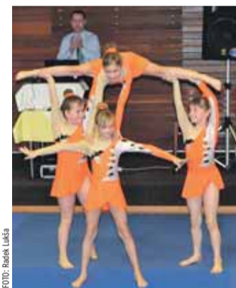
Děvčata z Gymnastiky ME Havířov během vystoupení.