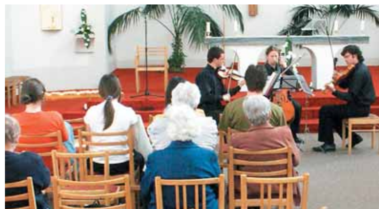
Místo kněze úřadovali u sv. Josefa studenti muzikanti.

Premiérový ročník má už dva „Koncerty budoucích hudebníků“ za sebou a dva před sebou.