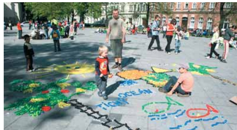
Na přívozkém náměstí stavěli z víček světadíly.