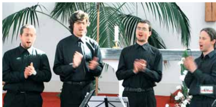
Černošský tradicionál měl v kostele v Ostravě úspěch.

Na scéně Velikonočního koncertu bylo smyčcové trio ( housle, viola a violoncello), bratrské duo s xylofonem a klavírem či dva soubory zpěváků. Ti podnikli na český katolický kostel něco nezvyklého – spustili tradicionály včetně jednoho černošského, publikum včetně několika babiček v letech roztleskali a rozhýbali podobně, jako je zvykem na americkém Jihu.