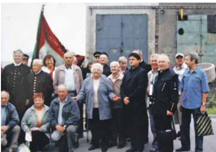
Kluby penzistů pořádají společné akce, často s hornickým podtextem.

KD Dolu Jeremenko, KD Dolu Odra (podnik i závod), KD Rekultivace, KD Dolu Fučík 1 i 3, KD Dolu Hlubina, KD Informačních technologií OKD, KD Dolu Zárubek, KD Dolu Bezruč, KD Dolu Koblov, KD Dolu Heřmanice, KD Dolu Šverma, KD Dolu Dukla, KD Dolu Paskov, KD Dolu František, Krojování horníků Dolu František.