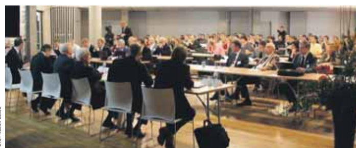
Konference Safety Engineering konaná v Dolní oblasti Vítkovice.

Platforma také v projektu Podpora a rozvoj bezpečnosti průmyslu v Moravskoslezském kraji pořádala konference, semináře i workshopy (Řešení protivýbuchové bezpečnosti v reálných podmínkách průmyslových provozů, Správná praxe, Kultura bezpečnosti, Safety Engineering). Účastníci se jich zástupci jak přímo OKD a HBZS, tak partneřů těžařů z Vysoké školy báňské – Technické univerzity Ostrava, VVÚU, RSBP či FITE. „A ve spolupráci s odborníky z těchto firem a institucí vyšla publikace Rizika průmyslových procesů s nebez-