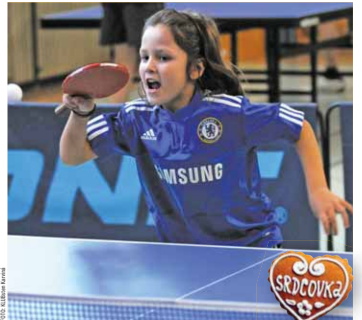
Na ZŠ Mendelova pořádá KLUBstén Karviná turnaj jednotlivců.