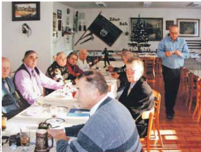
Nejaktivnější i největší klub tvoří bývalí pracovníci Dolu František.