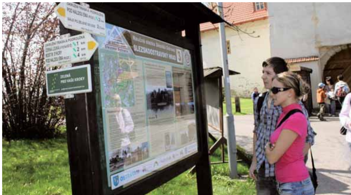
Trasu na Emu díky grantu Nadace OKD lemují 12 panelů s obrázky a zajímavými texty.

Vždyť jenom na území dnešní Slezské Ostravy bylo zmapováno 142 starých jam! Výtvozem hornické činnosti je i samotná Ema, na které bylo uloženo asi 28 milionů kubíků hlušiny. Těsně po ukončení navážky čněl její vrcholok do výšky 327 metrů nad mořem, vlivem přirozeného slehávání horninového materiálu je ale dnes asi o 12 metrů nižší. V útrobách této významné ostravské přírodní a technic-