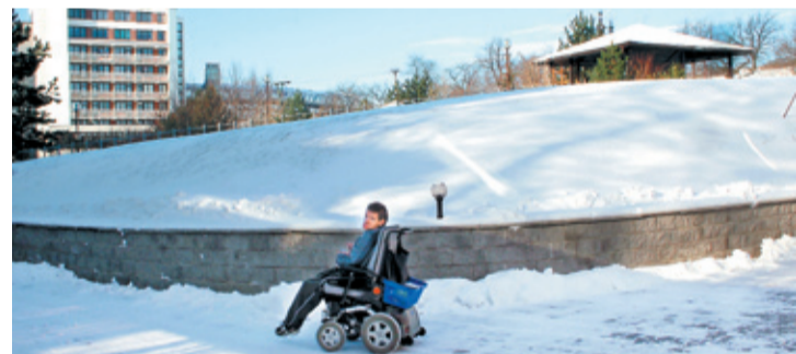
Současný stav s pohledem na areál ústavu sociální péče a plán do budoucnosti (dole).

HRABYNĚ - Prostedí léčebny a ústavu sociální péče v Hrabyni na Opavsku bude mít hezkou zónu klidu a odpočinku. Počítá s tím projekt místní Charity. Vzhled a terénní úpravy navrhla zahradní architektka Lenka Vašíčková a skoro celé to v programu „Pro budoucnost“ zaplatí Nadace OKD.