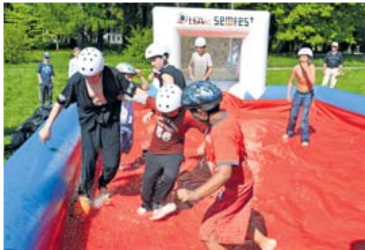
Jednou z atrakcí, o kterou byl mezi kluky velký zájem, byl turnaj ve vodním fotbale.

Nízkoprahový klub Fontána nabízí odbornou pomoc i zábavu