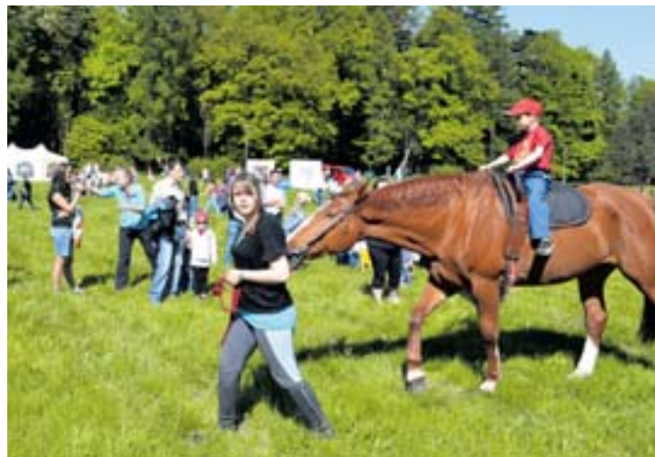
Projížďka na koni byla velkým zážitkem pro většinu přítomných dětí.

Nízkoprahové zařízení Fontána založil Klub mladých Filadelfia v Karviné v roce 2003. Funguje v kulturním domě Beseda ve Fryštátě (bývalá požární zbrojnice). Je chráněným místem pro mládež, která zde nachází jak podporu a odbornou pomoc, tak i zábavu a prostor pro vlastní aktivity. Vstup do klubu je zdarma pro všechny ve věku 7 až 18 let. Obecným cílem nízkoprahových zařízení je minimalizovat rizika související se způsobem života dospívajících a umožnit jim lépe se orientovat v jejich sociálním prostředí a řešit jejich problémy. syf