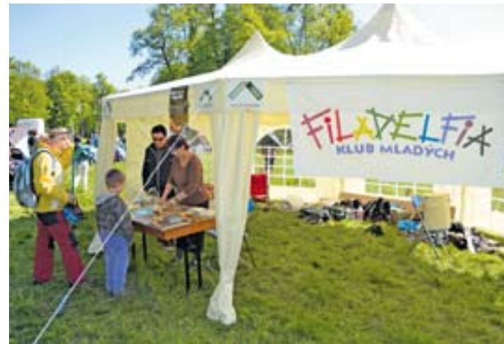
Občanské sdružení Filadelfia organizovalo v sobotu zábavné odpoledne Fontána v akci.

K hlavním cílům hry „Nástrahy velkoměsta“ patří prožitky a zapojení celé rodiny. „Maminky a tátové se věnovali svým dětem skutečně naplno. Začínali jsme totiž dvě hodiny po poledni a končili o půl deváté večer,“ doplnila Vápeníková sestra Zdeňka, patřící také k pořadatelům. Ti vyhlásili i fotosoutěž záběrů z letošních hry. Více na internetu www.valimese.eu . Radek Lukša