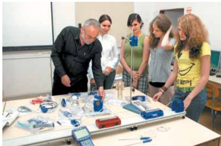
Studentky prvního ročníku se seznamují s věcíčkou jménem Pasco.