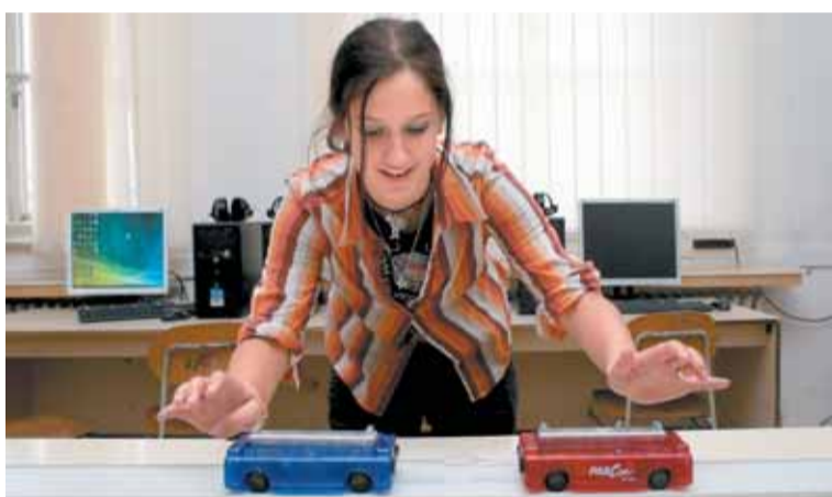
Součástí je i dráha s autičky, například pro měření vzdálenosti.