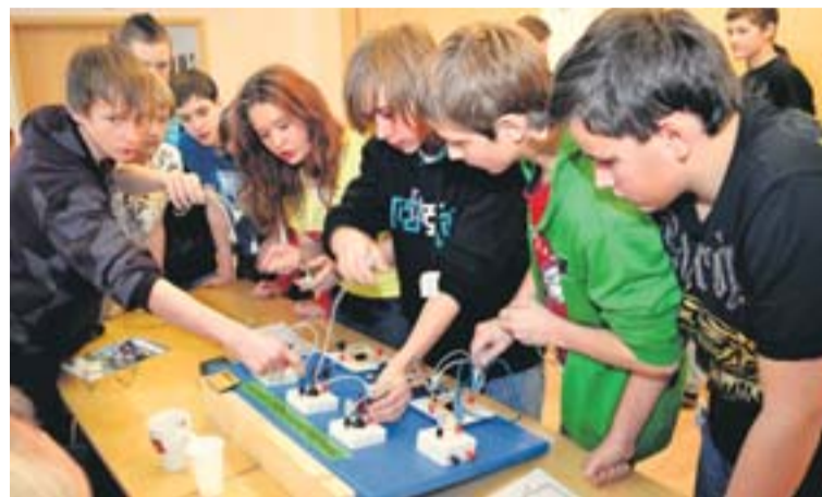
Na soutěžních stánkách byl znát zápal kluků a děvčat při snaze vyřešit daný úkol.

A kdo v dopolední části zvítězil? Byla to družstva základních škol Dětská, Provaznická a Krestova. Blahopřejeme.