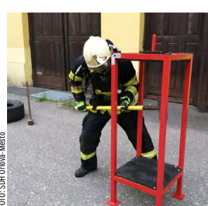
Hammer Box, neboli Thorovo kladivo.