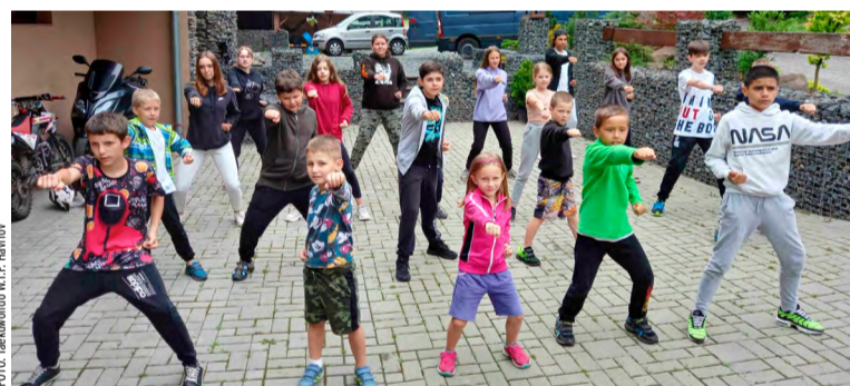
Soustředění v Beskydech.