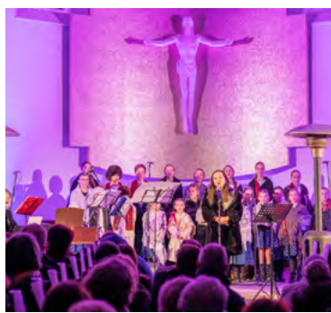
Benefiční vystoupení ve Frýdku-Místku.

„Umožnilo to dětem uskutečňovat výtvarné a pracovní činnosti, které jim přinášejí potěšení, uplatnění talentu, zručnosti a kreativity a dále jim zprostředkovalo setkání s řadou známých umělců,