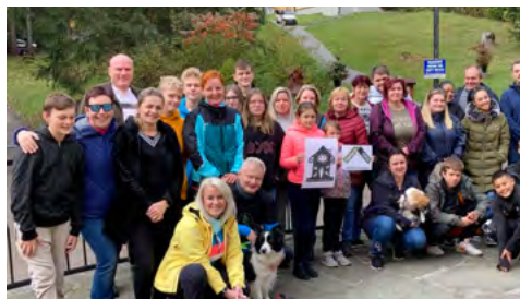
Společný barbořkovský podzimní víkend.

„Nesmírně nás těší, že je jich stále méně a méně. A jako každý rok si přejeme, ať samozřejmě žádný další nepřibude,“ doplnila Němcová. Barborka totiž nepřijala novou rodinu už poslední tři roky, kdy se v OKD nestal smrtelný úraz.