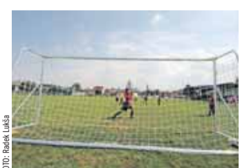
Nová branka ze Srdcovky.

„Slouží k zápasům na šířku hřiště a využívají je především naše družstva přípravy, mladších