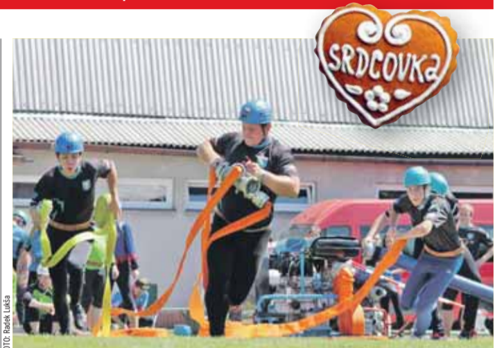
Zatímco muži z SDH Frýdek skončili v soutěži pátí, ...