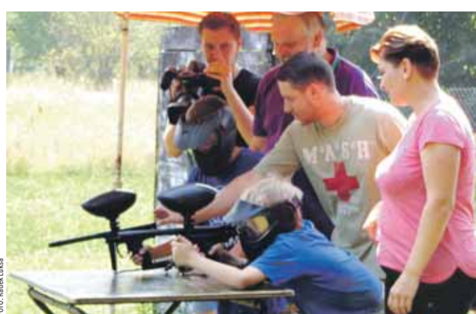
Příměstský tábor sdružení ADAM měl nabitý program, včetně paintballu.