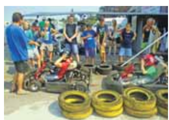
Každý den se nesl ve znamení jiné aktivity, v pondělí jízdy na motokarách.

ře pro větší, na koni pro ty menší a výlet do Chlebovic na rozhlednu. Úterý? Pěšky pochod s geocachingem z Těrlicka do Albrechtic na paintball. Středa? Aquapark v Olomouci. Čtvrtek? Návštěva funparku Žirafa v Ostravě pro menší a sjíždění řeky Opavy na raftech. A pátek? Společná prohlídka technických expozic a zajímavostí v U19 v Dolní oblasti Vítkovice.