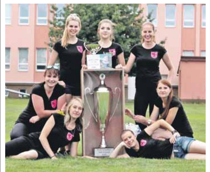
... ženské družstvo získalo opět Pohár Nadace OKD.