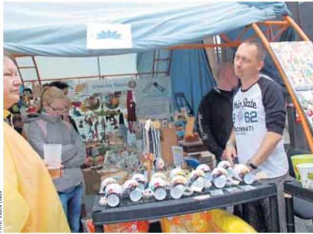
Chráněná dílna CHRPA Krnov byla oceněna za nejlepší projekt roku 2013 v kategorii Pro zdraví.

Zaměření pouze na hornický region je dáno také současnou tíživou hospodářskou situací, jež se nevyhnula ani revíru OKD. „Což ovšem v žádném případě neznamená, že by Nadace OKD nějak slevila ze svých priorit, k nimž patří hlavně podpora hendikepovaných a jejich zařazení do společenského,