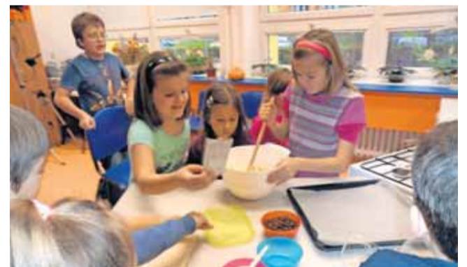
My to společně zvládneme je projekt ZŠ Ukrajinská, který vyhrál kategorii Pro Evropu.

více informací na webu NOKD, telefonu 596 262 118 a emailu info@nadaceokd.cz