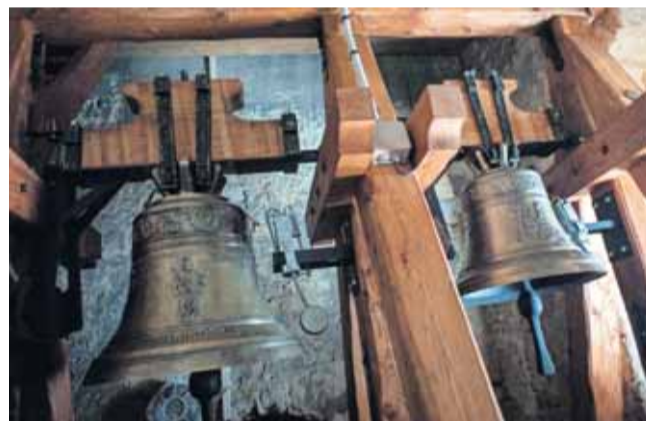
Zvony do šikmého kostela v Karviné-Dolech, nejlepší projekt kategorie Pro budoucnost.