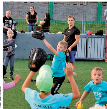
Orlovské baseballisty podporuje NOKD.

Projekt, jak upřesnil, počítá s modernizací opěrek pro děti, které ještě neumí samy na ledě stát ani se pohybovat. „Tyto pomůcky jim půjčujeme stejně jako přílby a brusle. Opěrné hrazdy se z důvodu velkého využívání adekvátně opotřebovávají a potřebujeme je postupně obnovovat,“ poznamenal Hanzl. Do letos podpořeného projektu se podle něj zapojily školky nejen přímo z Orlové, ale rovněž Petřvaldu, Rychvaldu či Dolní Lutyně.