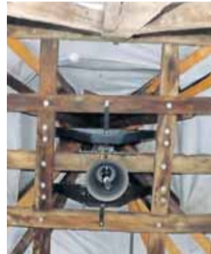
Nový zvon zavěšený ve věži.