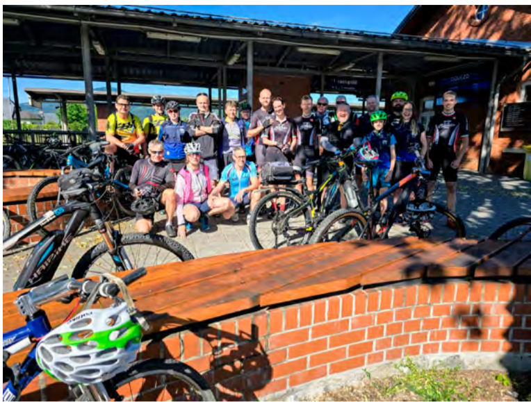
Bystřice – Ustroň, to byl cyklovýlet v režii chlapů ze šachty.