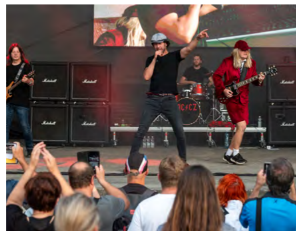
Příznivce rockové hudby potěšilo vystoupení AC/CZ.