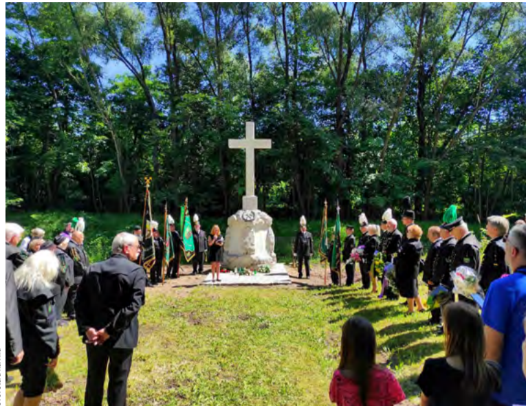
Pietní akt u renowovaného památníku obětí důlní katastrofy v roce 1894 v Karviné.

Zmínil též, že osmdesát procent obětí následků výbuchu metanu a uhelného prachu zahynulo v dů-