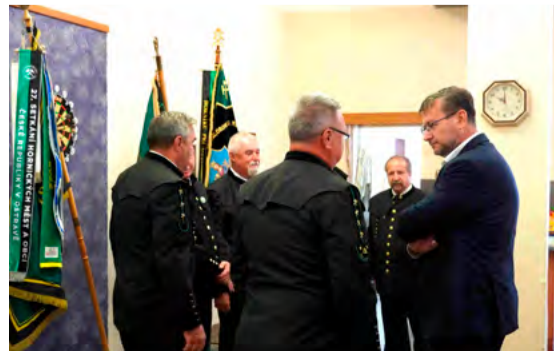
Krojovaní horníci z Armády s primátorem Karviné (vpravo).