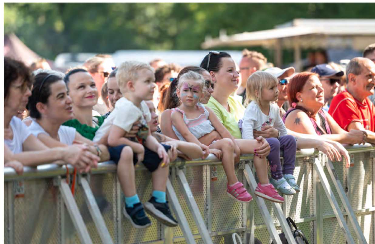
Program myslel na malé i velké návštěvníky.