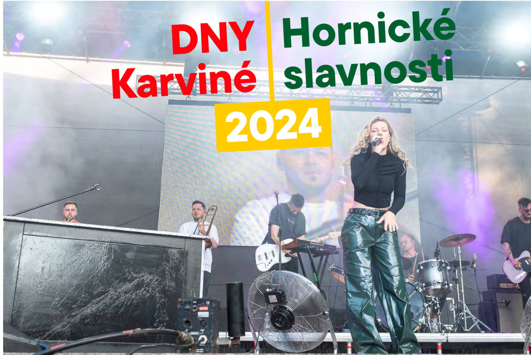
Držitelka ceny Anděl Lenny.