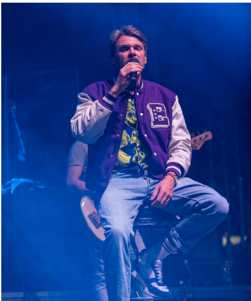
Publikum bavil i Vojtěch Dyk s kapelou D.Y.K.