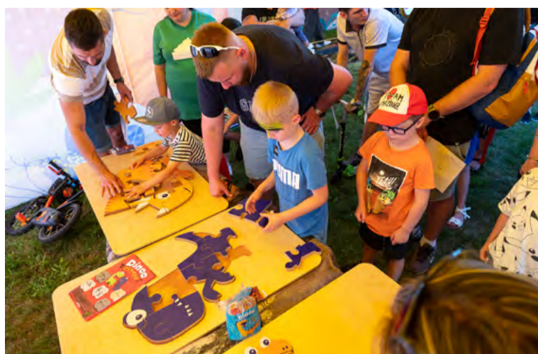
Soutěže s dinosaurí tématikou.