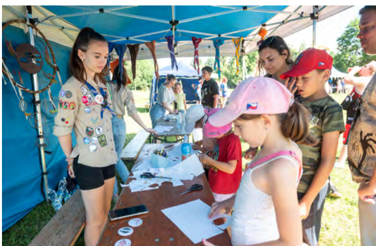
Kreativní dílničky NOKD.