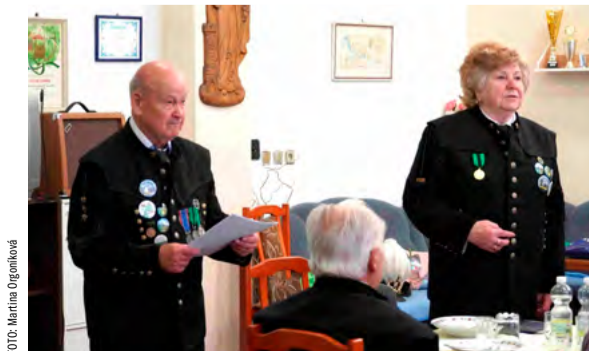
Předsedkyně klubu s nejstarším členem na karvinském úřadě.