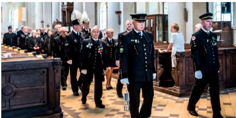
Svatoprokopská slavnost v ostravské katedrále.

OSTRAVA – Patrona horníků a hutníků sv. Prokopa si havířská veřejnost připomněla v pátek 21. června v ostravské katedrále Božského Spasitele.