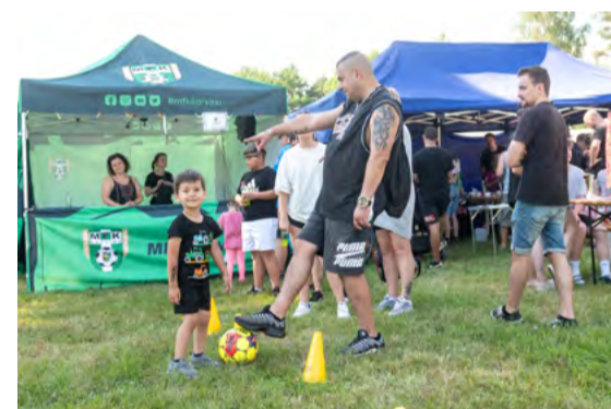
Na akci nechyběl ani MFK Karviná.