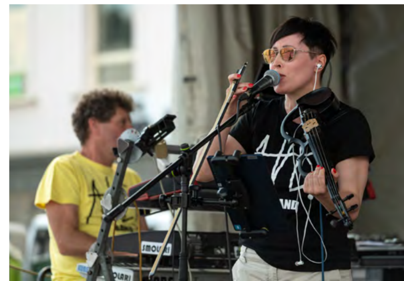
Lokální kapela Ave!Band.