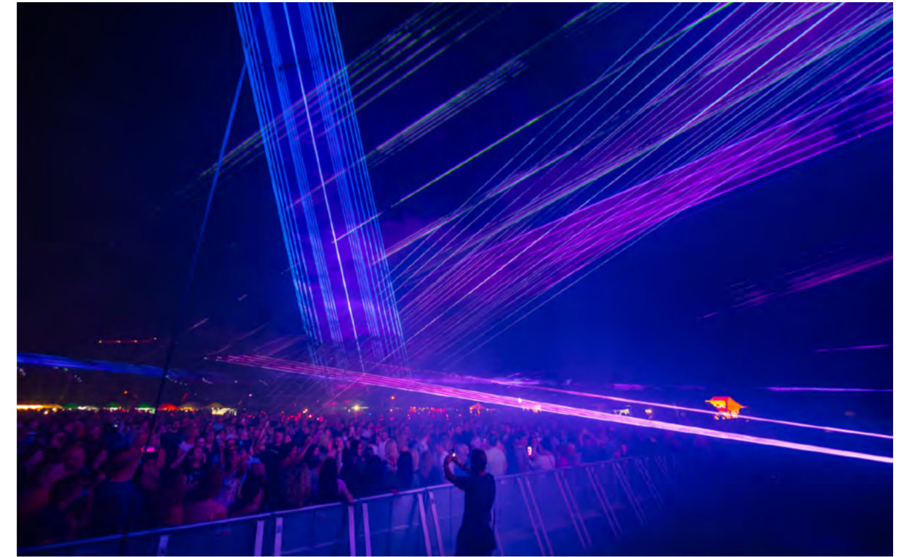
Program celé akce zakončila monumentální laser show.