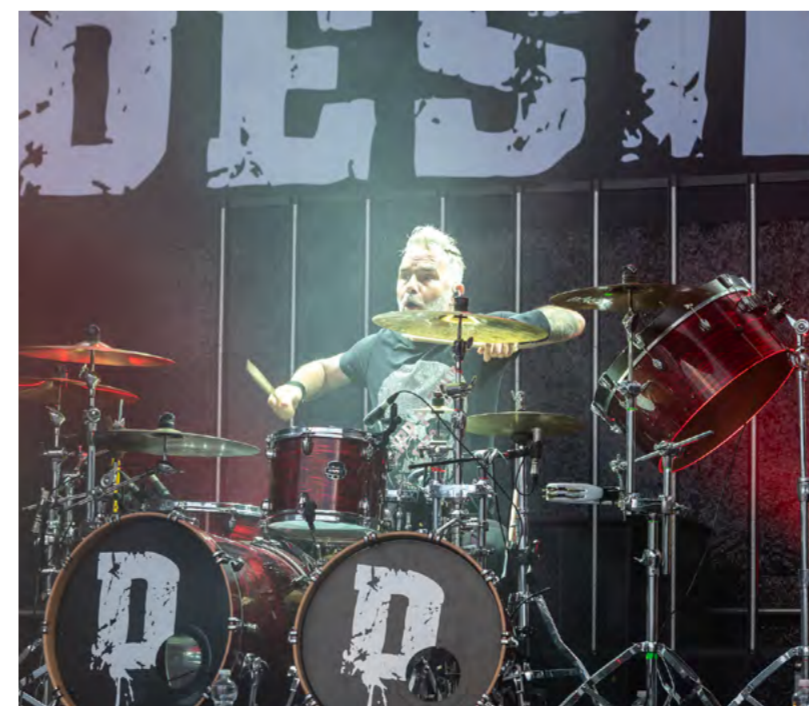
Sedminásobný držitel slovenského Zlatého slávika kapela DESmod.