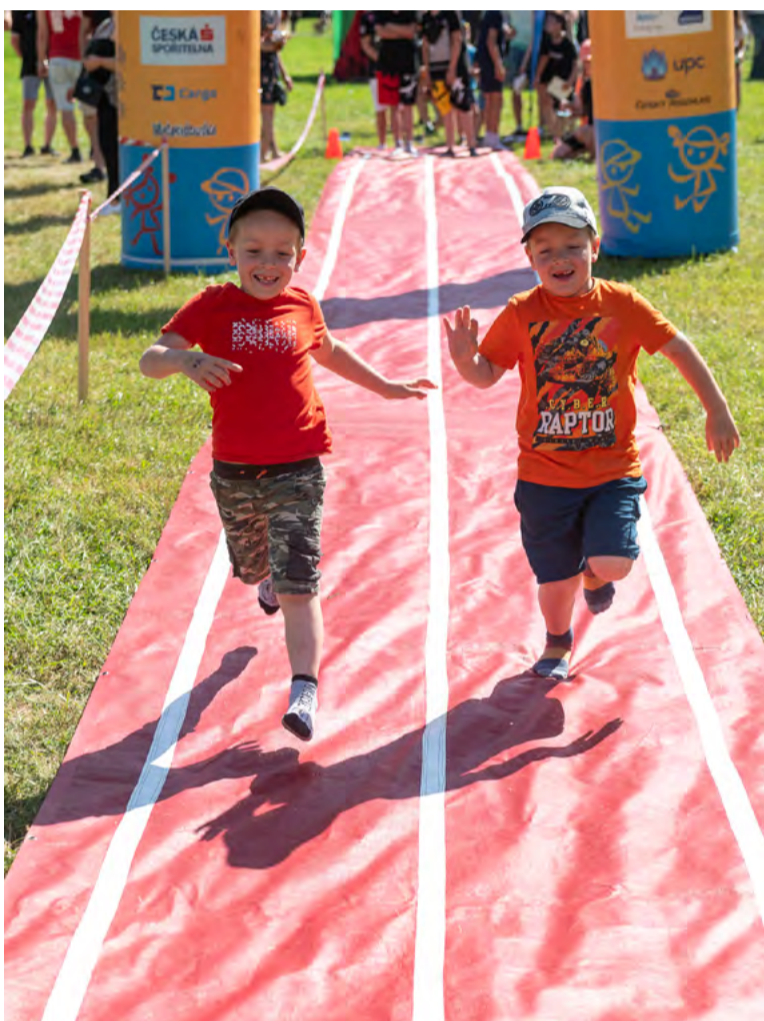
Děti si také zasportovaly.