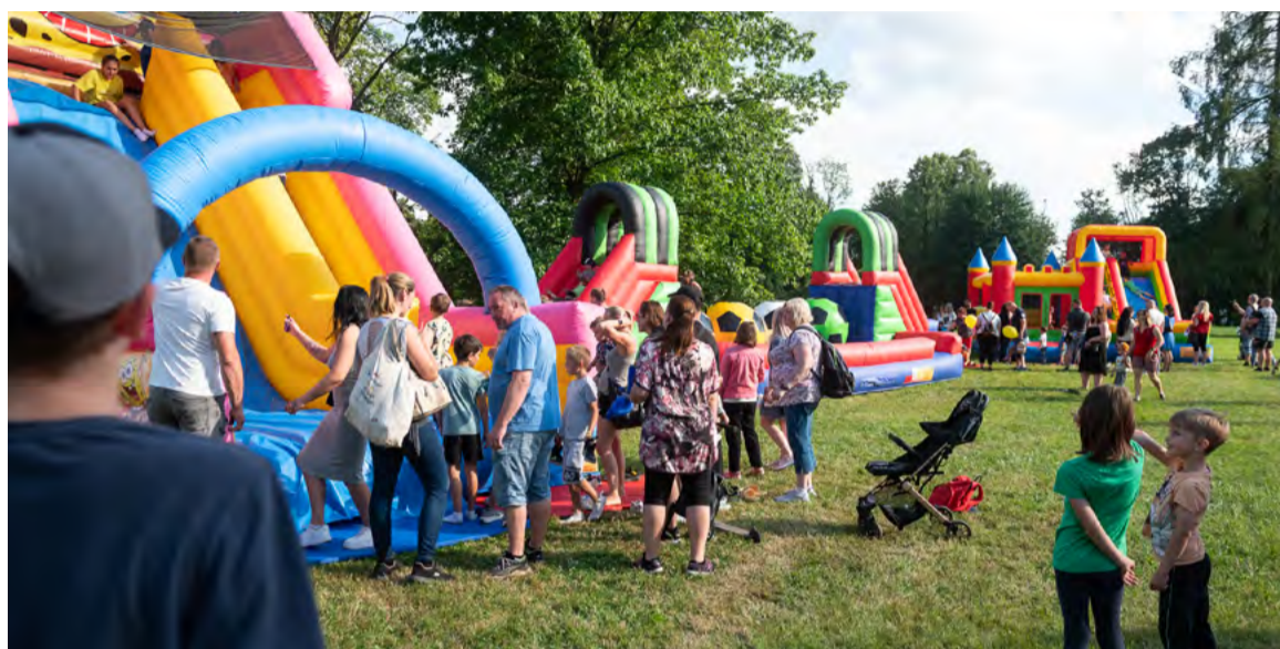
Malé návštěvníky potěšily nafukovací atrakce.