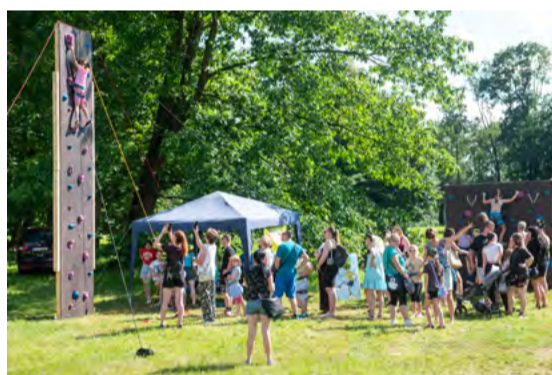
Horolezecká stěna pro děti.