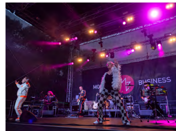
Kapela Monkey Business předvedla skvělou show.