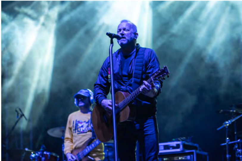
K hlavním hvězdám patřil David Koller.