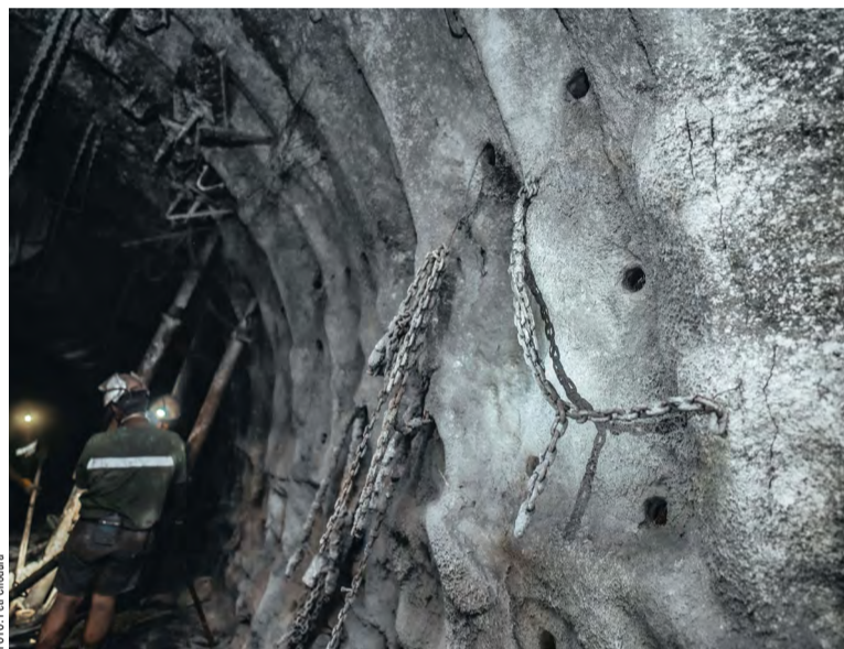
Torkretování v praxi, tak to vypadalo v porubu 402 202.

Cílem torkretování důlní chodby je provedení plynotěsného nástřiku, který co nejvíce omezí pronikání