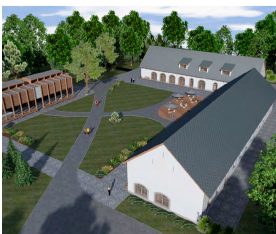
Vizualizace projektů plánovaných v Petrovích u Karviné (vlevo) a Karviné.