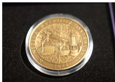
Medaile oslavující ostravskou neživou přírodu a hornictví.

První medaili věnovali autoři projektu Živé přírodě Ostravska, s podtitulem věda a školství. Pak následovala témata Ostrava jako centrum obchodu – historické dědictví. Osídlení území Ostravy – město tvořené člověkem a nyní Neživá