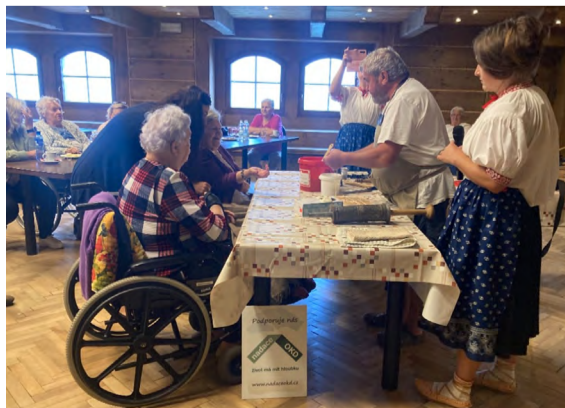
Senioři z orlovské Pohody si užívali v Mostech u Jablunkova.

„Celá akce byla velmi inspirativní a přinesla nejen kulturní zážitek, ale i hlubší porozumění tradičním řemeslům a umění. Klienti domova si výlet velmi užili, odnesli si spoustu krásných vzpomínek, které jim zůstanou v srdci,“ dodala aktivizační pracovnice Domova seniorů Pohoda Orlová.