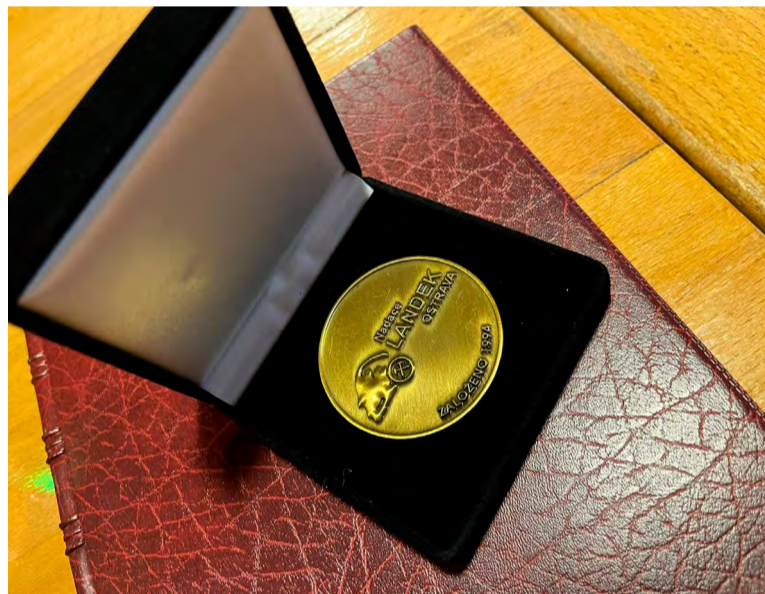
Pamětní medaile od Nadace Landek Ostrava.