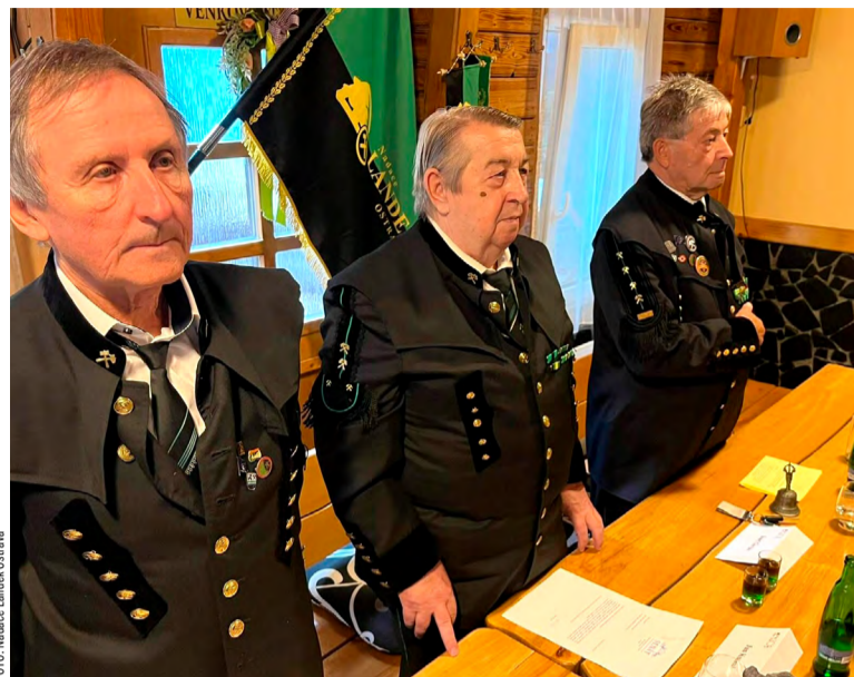
Představitelé nadace na oslavě 30. výročí.

Do 1. kola výběrového řízení Nadačního programu 2025 pro získání příspěvku podali žadatelé celkem 28 přihlášek s celkovým požadavkem na spolufinancování ve výši 1 610 400 korun. Správní rada pak na zasedání 29. října schválila 16 projektů s částkou přiznaných nadačních příspěvků ve výši 729 tisíc korun. Uzávěrka pro přijetí přihlá-