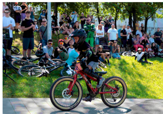
Farej do lesa na kolo.