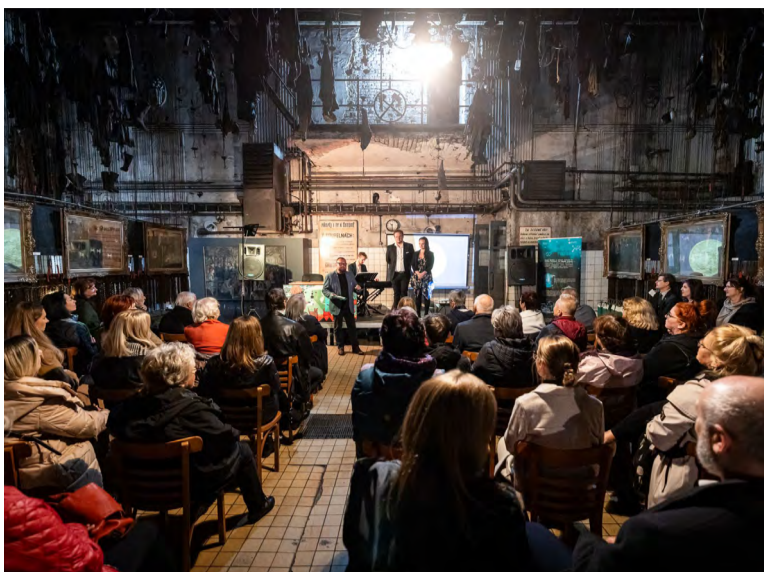
Představení se uskutečnilo v řetězových šatnách Dolu Michal.