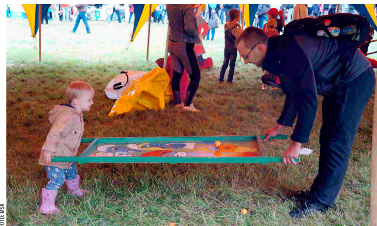
Loňské městečko se vydařilo a pobavilo.

hold všem, kdo hornickému řemeslu zasvětili svůj život. Celý výtěžek z prodeje kalendáře poputuje Spolku svatá Barbora. Ten od roku 2004 podporuje děti, jimž zahynul rodič na následky pracovního úrazu. Osirelým dětem pomáhá zajistit dostatek financí na studium, zájmovou činnost, rozvoj talentu i ozdravné pobyty.