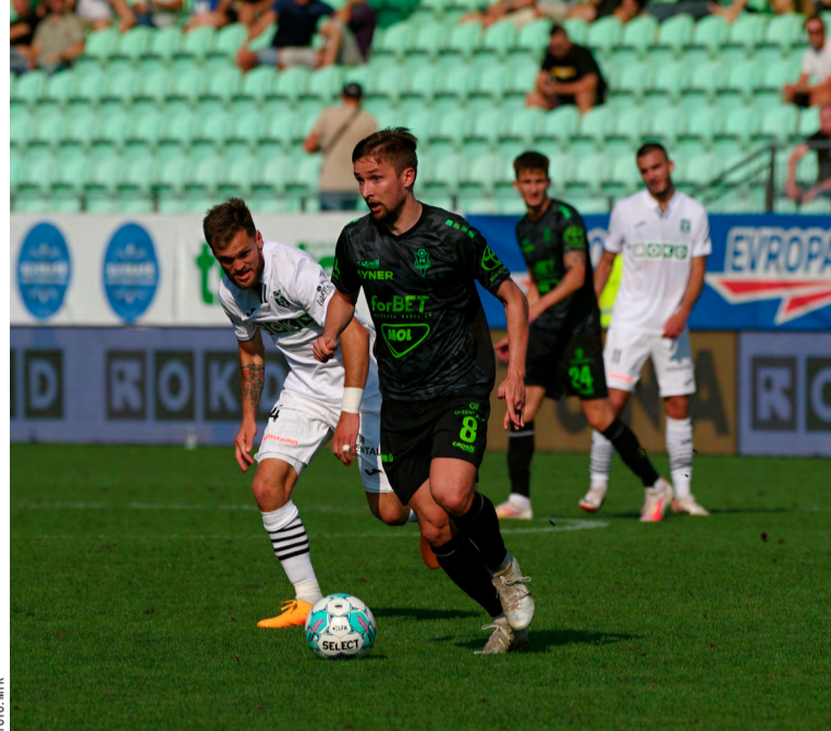
MFK má za sebou těžký boj a čeká ho další.