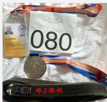
Černý pásek a medaile z mistrovství.